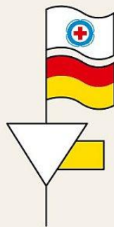
Baden und Schwimmen gefährlich Use caution, bathing and swimming dangerous