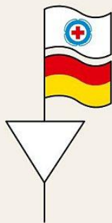
Wasserrettung im Dienst Lifeguard on duty