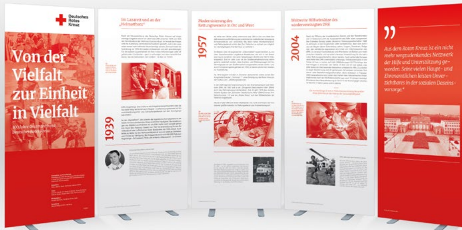
Beispieltafeln aus der Ausstellung