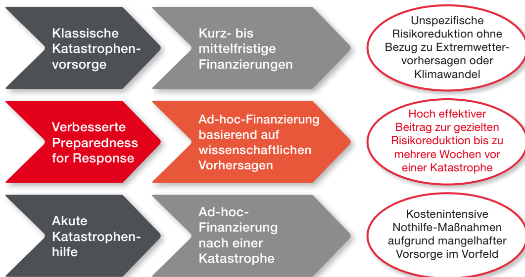
Abbildung 1: Verbesserte Preparedness for Response und gezielte Reduktion von kurzfristig steigenden Katastrophenrisiken durch die Nutzung wissenschaftlicher Extremwettervorhersagen.

Der humanitäre Mittelbedarf und die Zahl der Menschen, die humanitäre Hilfe benötigen, sind in den letzten 10 Jahren stetig gestiegen. Klimarisiken im Allgemeinen, verstärkt durch die Auswirkungen des Klimawandels, sind für diesen enormen Anstieg mitverantwortlich. Die aktuellen und zukünftigen Klimarisiken, in Kombination mit einer oftmals ungeplanten Urbanisierung, mangelnder Ernährungssicherung, einem schlechten Management natürlicher Ressourcen, dem Bevölkerungswachstum und extremer Armut, stellen insbesondere die Menschen in Entwicklungsländern vor enorme Herausforderungen. Diesen Entwicklungen steht die Realität stagnierender Mittel für die humanitäre Hilfe gegenüber. Diese Situation macht es notwendig nach innovativen Lösungen zu suchen, um den Einsatz der knappen Mittel effizienter (günstiges Verhältnis von Einsatz und Ergebnis) und effektiver (Wirksamkeit) zu gestalten. Das Auswärtige Amt nimmt hier eine Vorreiterrolle ein.