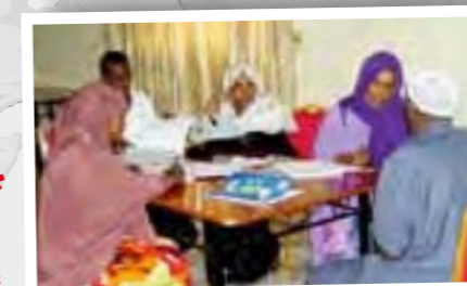
In Arbeitsgruppen werden Informationsveranstaltungen vorbereitet

SOMALIA: Das DRK kämpft erfolgreich für Mädchen in Somalia und gegen den Brauch der weiblichen Genitalbeschneidung.