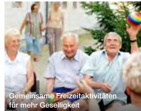
Gemeinsame Freizeitaktivitäten für mehr Geselligkeit

Demenz ist eine Krankheit, die sich schleichend ankündigt. Oft beginnt sie damit, dass man sich einfach nicht mehr an alles erinnern kann. Betroffene vergessen überdurchschnittlich oft Arzttermine oder