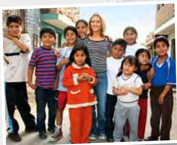
Jeanette Biedermann bei der Einweihung des Kinderzentrums „Las Luces“ 2004 in Lima