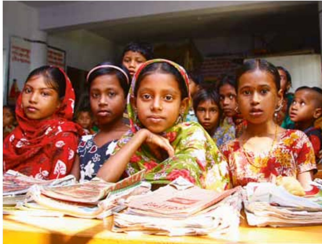
Schülerinnen in Bangladesch: Vor allem Kinder leiden unter den Naturkatastrophen