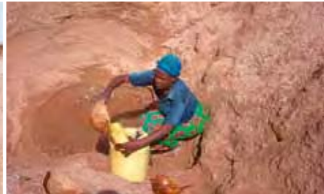
Jeder Tropfen Wasser zählt