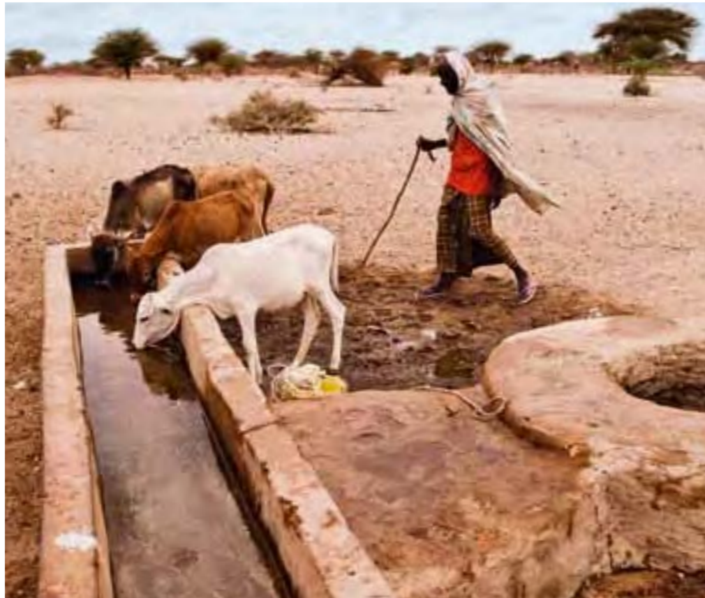
Menschen und Tiere müssen sich Wasserquellen teilen

OSTAFRIKA: Am Horn von Afrika wurden die Menschen von einer der schwersten Dürren seit Jahrzehnten heimgesucht. Vor Ort stillen Rotkreuzhelfer unermüdlich Hunger und Durst.