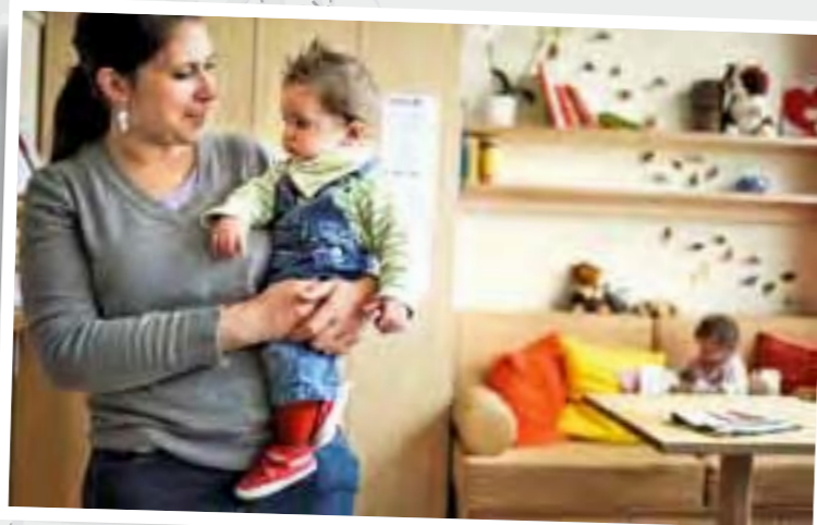
Auch alleinerziehende Mütter finden durch das DRK-Programm „Opstapje“ Unterstützung