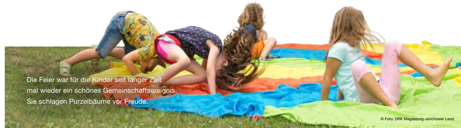
Die Feier war für die Kinder seit langer Zeit mal wieder ein schönes Gemeinschaftsereignis. Sie schlugen Purzelbäume vor Freude.

Damit dies auch so bleibt und das DRK in Magdeburg sein Angebot ausweiten kann, benötigt der Club finanzielle Unterstützung für Sportgeräte wie Tischtennis, Federball und Fußball. Zudem ist geplant, einen Kühlschrank zu kaufen, denn zukünftig sollen in der Küche gemeinsam gesunde Mahlzeiten vorbereitet und gegessen werden. Bitte unterstützen Sie DRK-Projekte für Kinder, Jugendliche und ihre Familien mit einer Spende.