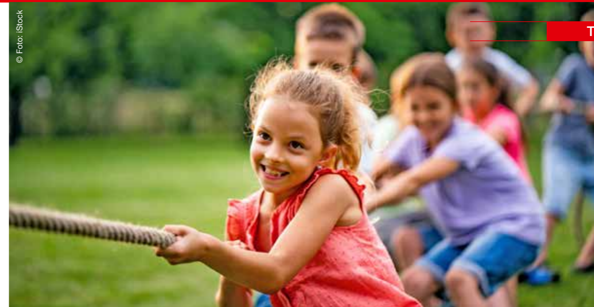
Alle ziehen an einem Strang: Beim gemeinsamen Spiel können Kinder sich gut ablenken und erholen.

Beschädigte Häuser, Keller voller Schlamm, besorgte Eltern. Kinder aus den Hochwassergebieten in Rheinland-Pfalz und Nordrhein-Westfalen mussten in diesem Sommer viel ertragen. Damit sie sich ablenken und erholen konnten, hat das DRK sie zu einer Woche Ferien in Mecklenburg-Vorpommern eingeladen.