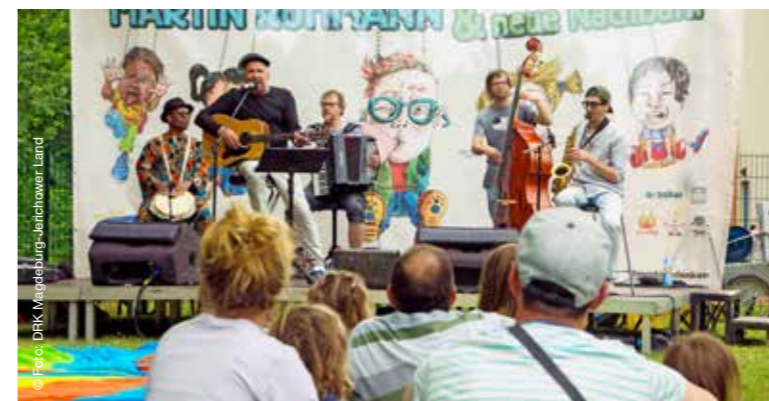
Die Eröffnungsfeier mit Musik, Akrobatik und Riesenseifenblasen kam bei allen Generationen gut an. In Zukunft sollen häufiger Veranstaltungen stattfinden.

Kinder und Jugendliche belastet die Pandemie schwer! Sie wünschen sich, endlich wieder etwas mit Freunden unternehmen und Spaß haben zu können. In Magdeburg gibt das DRK ihren Wünschen Raum.