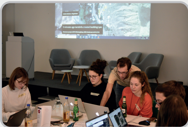
Erfahrene Freiwillige helfen bei den ersten Schritten. So gelingt ein schneller Start in den Mapathon!

Dieses Engagement soll nun verstärkt werden. Deshalb veranstaltet das DRK gemeinsam mit dem Heidelberg Institute for Geoinformation Technology eine Reihe von 25 „Mapathons“ in DRK Verbänden in ganz Deutschland. Gefördert wird dieses Projekt von der Klaus Tschira Stiftung. Ziele sind zum einen die Bekanntmachung des Projekts an sich, aber vor allem auch die Möglichkeit, das DRK-Freiwillige unsere internationalen Projekte aktiv und von zu Hause aus unterstützen können.